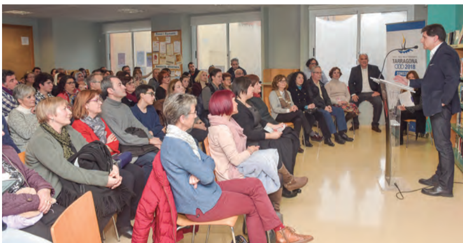
Acte d'entrega dels XI Premis Literaris a la Biblioteca