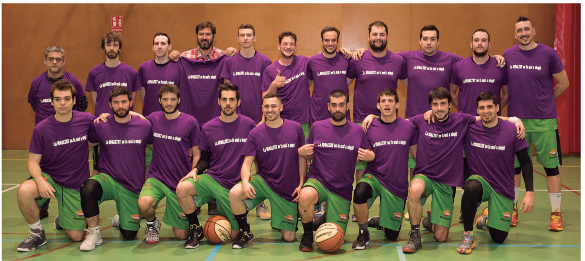
Els equips de futbol i bàsquet van lluir samarretes reivindicatives de la igualtat de gènere