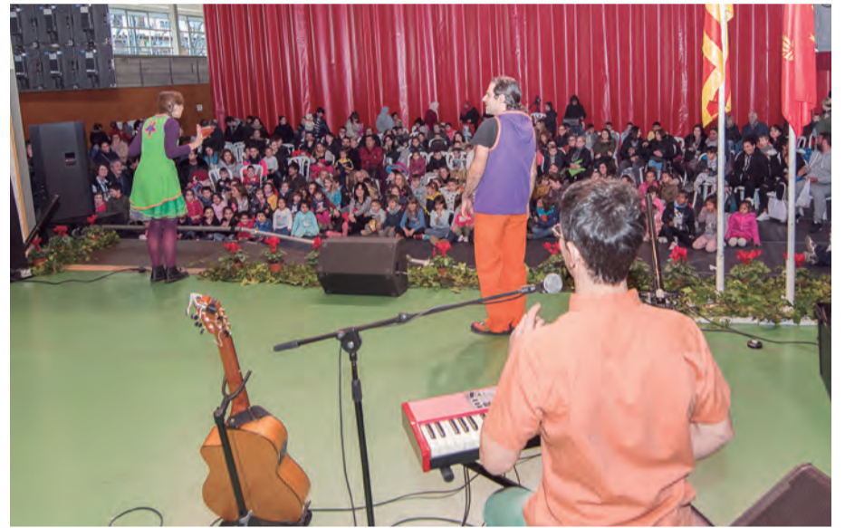
Espectacle infantil al Pavelló Poliesportiu