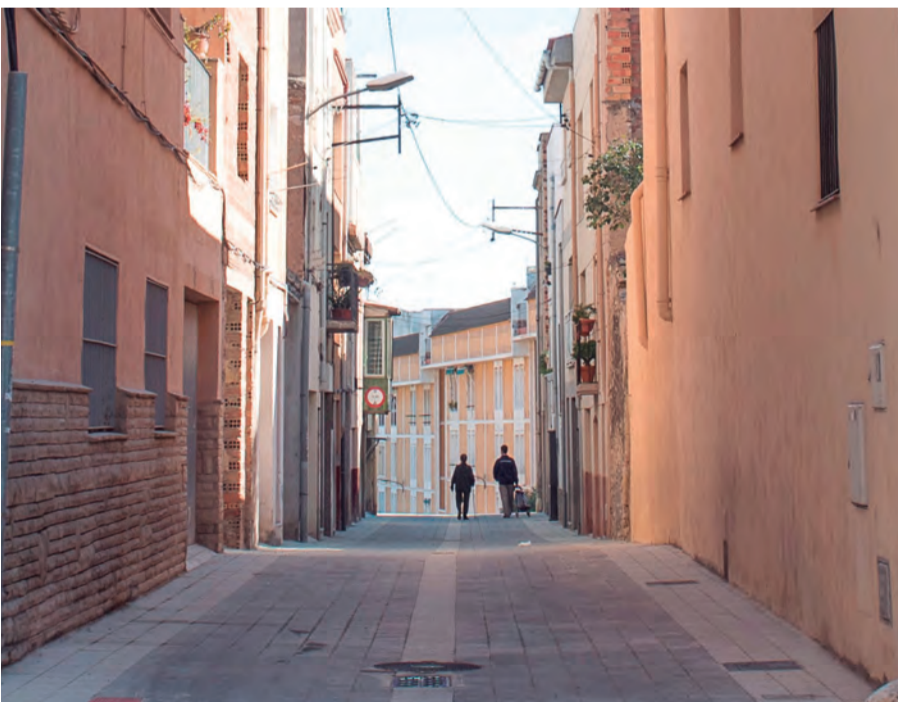
Accés al carrer Pallaresos des del carrer Major

Les obres han consistit en la renovació de la xarxa d'aigua potable, la xarxa de clavegueram i els paviments del carrer. A més, s'ha adaptat el carrer a la normativa actual pel que fa a l'amplada de la calçada i les voreres, millorant la seva accessibilitat. L'àmbit d'execució del projecte ha comprès entre la cantonada del carrer Major amb el propi carrer Pallaresos, fins un tram abans d'arribar al carrer Jaume I. El cost final dels treballs ha estat de 96.695,97 euros (IVA no inclòs), i les obres s'han executat en un termini inferior als tres mesos. A través d'una subvenció d'Endesa, properament s'iniciaran també els treballs per soterrar el cablejat elèctric del carrer.