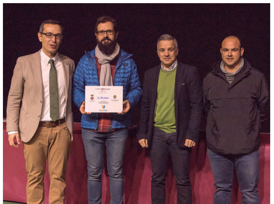
L'alcalde i representants del Centre d'Esports Constantí, amb el guanyador del 1er premi del concurs Instagram