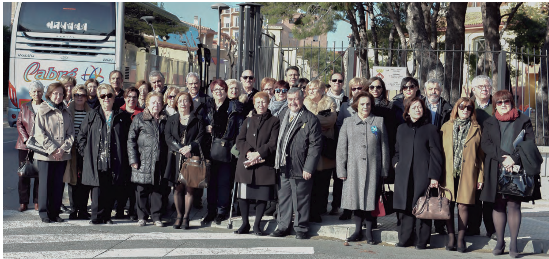
Participants a la Sortida al Gran Teatre del Liceu

Una quarantena de persones van participar el passat 28 de gener de la sortida al Gran Teatre del Liceu de Barcelona, que organitzava l'Ajuntament de Constantí, amb la col·laboració de l'Associació Amics de la Música de Constantí. Els participants van poder gaudir de l'òpera "L'elisir d'amore", de Gaetano Donizetti. Es tracta d'una de