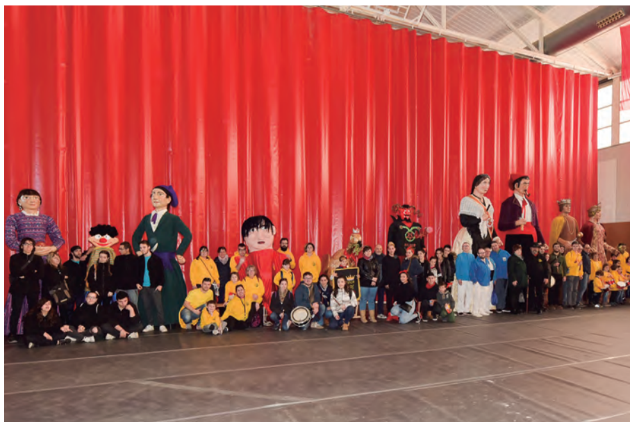
Participants a la Trobada Gegantera