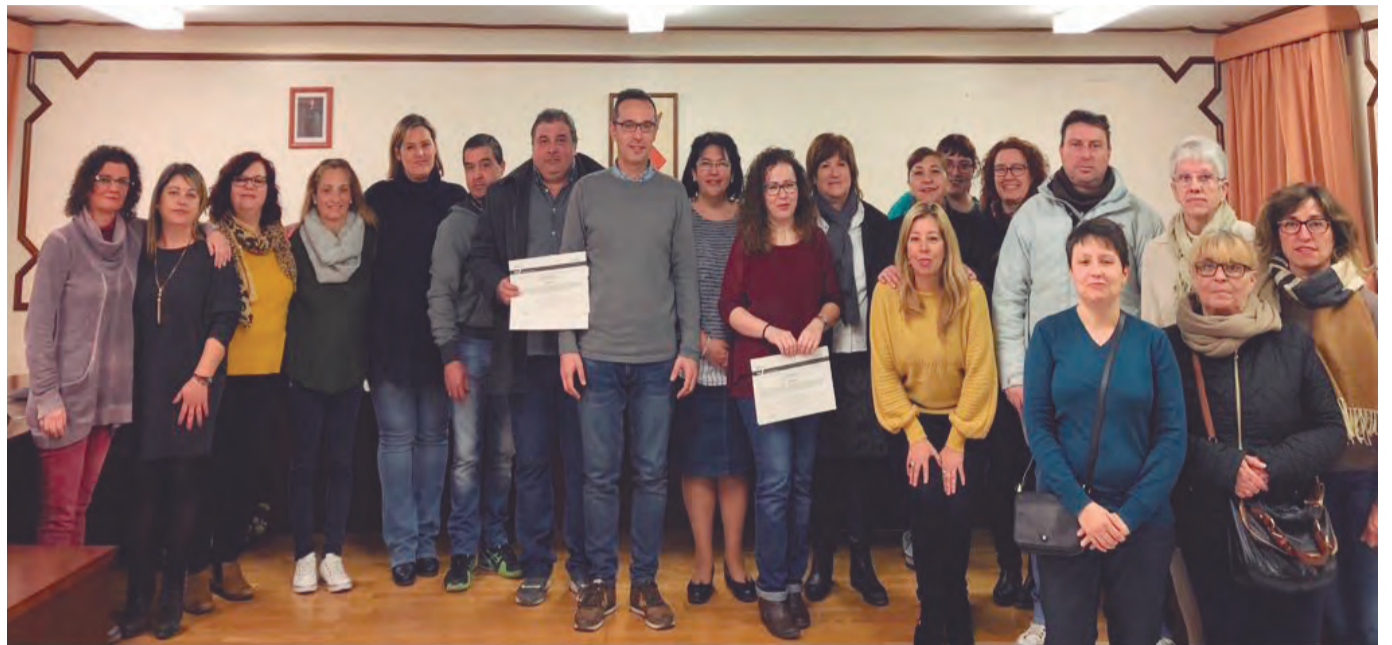
Acte d'entrega de diplomes dels cursos del SOC a la Sala de Plens de l'Ajuntament

Un total de 45 persones va participar entre desembre de l'any 2016 i octubre de 2017 dels 3 cursos de formació ocupacional que ha desenvolupat l'Ajuntament de Constantí, gràcies a una subvenció de 91.038 euros de la convocatòria del FOAP (Formació Ocupacional en Àrees Prioritàries) del 2016. Amb aquesta subvenció s'han pogut fer 3 cursos formatius, totalment subvencionats pel SOC (Servei d'Ocupació de Catalunya) i el Fons Social Europeu, i adreçats a persones en situació d'atur: -un curs d'Operacions auxiliars de serveis administratius i generals (Nivell 1. 450 hores); -un curs d'Atenció socio sanitària a persones dependents en institucions socials (Nivell 2. 470 hores); i un curs d'Operacions auxiliars d'enregistrament i tractament de dades i documents (Nivell 1. 460 hores). Aquests cursos han permès l'obtenció del certificat de professionalitat als alumnes participants. ■