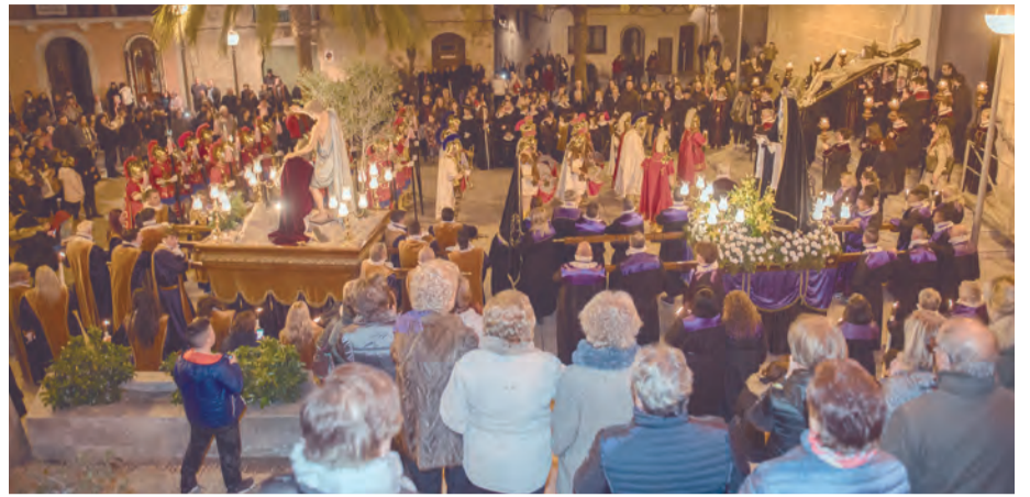
Processó de Divendres Sant