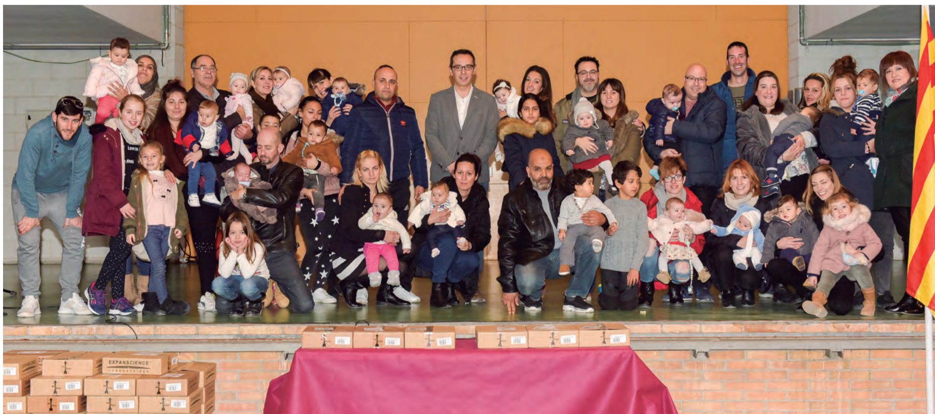
Acte de benvinguda als infants nascuts durant l'últim any

lies. Durant el 2017 han nascut i s'han inscrit i empadronat a Constantí 27 nenes i 29 nens. ■