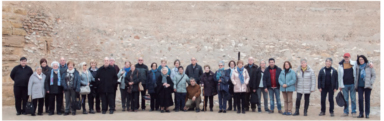
Participants de la 3a Sortida Raimundiana

El passat 10 de març es va celebrar 3a Sortida Raimundiana organitzada per la Parròquia de Sant Feliu. Més d'una trentena de persones van prendre part d'aquesta ruta que un any més s'ha organitzat amb l'objectiu d'aproximar les persones participants a la figura de Sant Ramon de Penyafort, que dona nom a l'ermita que tenim al terme municipal. Si a la 1a edició es van visitar les poblacions del Pla de Santa Maria, Masllorenç i Vila-rodon, i en la segona edició es va anar fins a Santa Margarida i els Monjos, aquesta tercera sortida raimundiana va constar d'una visita a l'ermita de Sant Ramon de Mont-roig del Camp i el Castell d'Escornalbou ■