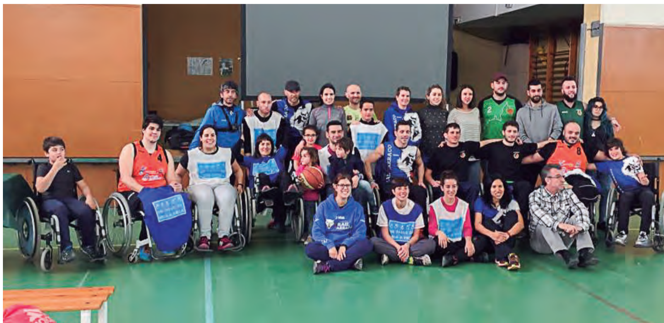
Participants a la jornada de conscienciació dels esports adaptats

El Pavelló Poliesportiu va acollir el passat 3 de març una Jornada de Conscienciació dels Esports Adaptats. L'esdeveniment, que va comptar amb la participació d'una trentena de persones, va ser organitzat per l'àrea social del Club Excursionista Trail Tarraco, la regidoria d'Esports de l'Ajuntament de Constantí i la Federació Mestral-Cocemfe Tarragona. Tota la recaptació obtinguda es destinava a la Federació Mestral-Cocemfe, que treballa activament per millorar la qualitat de vida de persones amb discapacitats. La jornada es va iniciar amb una breu xerrada informativa a càrrec de la Federació Mestral-Cocemfe sobre la realitat dels esports adaptats i els esportistes amb discapacitat. Posteriorment, tots els participants van poder experimentar aquesta realitat amb un partit de bàsquet amb cadira de rodes. ■