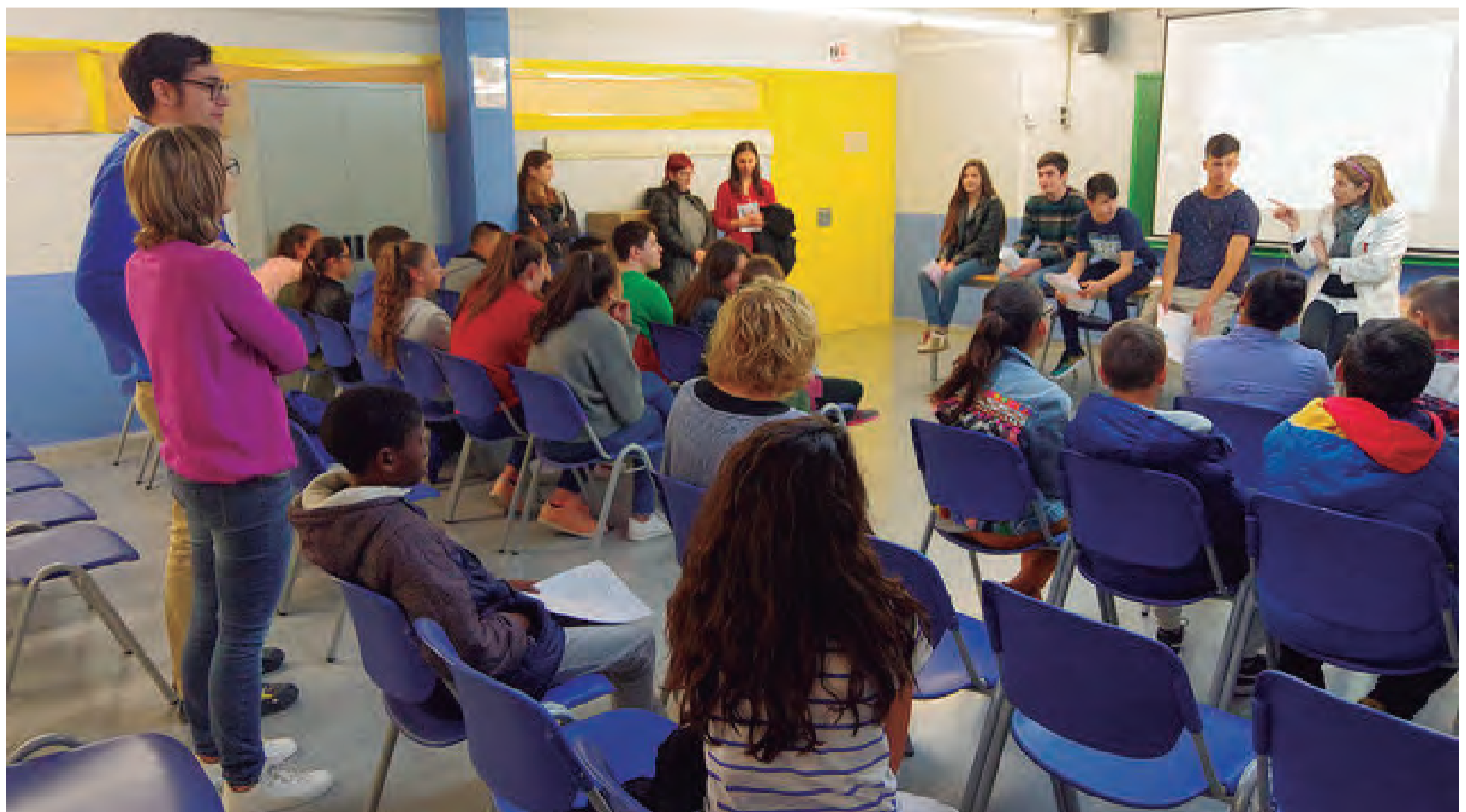
Un moment de la visita dels futurs alumnes de l'Institut

Una setmana abans, entre el 4 i el 6 d'abril, també es van realitzar les habituals jornades de portes obertes a les escoles Mossèn Ramon Bergadà i Centcelles. ■