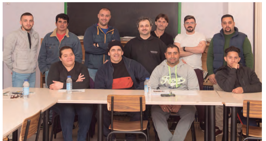
Alumnes participants al curs de mosso de magatzem i carretoner

deries i el registre d'aquests moviments. També s'ha ensenyat com controlar els estocs, i verificar i supervisar el bon ús i funcionament. El curs també ha constatat d'una part pràctica on els participants han après a conduir amb garanties de qualitat i seguretat carretons elevadors frontals i retràctils, d'acord amb la normativa vigent aplicable. ■