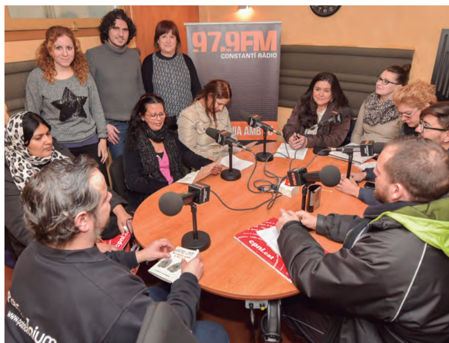
Els alumnes de català van llegir poemes en les seves llengües d'origen a Constantí Ràdio

Alumnes de català del Consorci per a la Normalització Lingüística de l'Escola d'Adults de Constantí van celebrar el Dia Internacional de la Llengua Materna, que es commemora el 21 de febrer, fent una lectura de poesies en el seu idioma d'origen a Constantí Ràdio. El Dia Internacional de la Llengua Materna va ser declarat per la UNESCO l'any 1999 en defensa del plurilingüisme. El 21 de febrer de 1952, estudiants i activistes del Pakistan van ser tirotejats pels militars i la policia a la Universitat de Dhaka. Tres joves estudiants i altres persones van ser assassinades quan reclamaven l'oficialitat del bengalí. L'objectiu d'aquesta celebració és promoure el multilingüisme i la diversitat cultural. ■