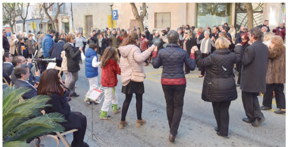
Ballada de Sardanes davant de l'Ajuntament