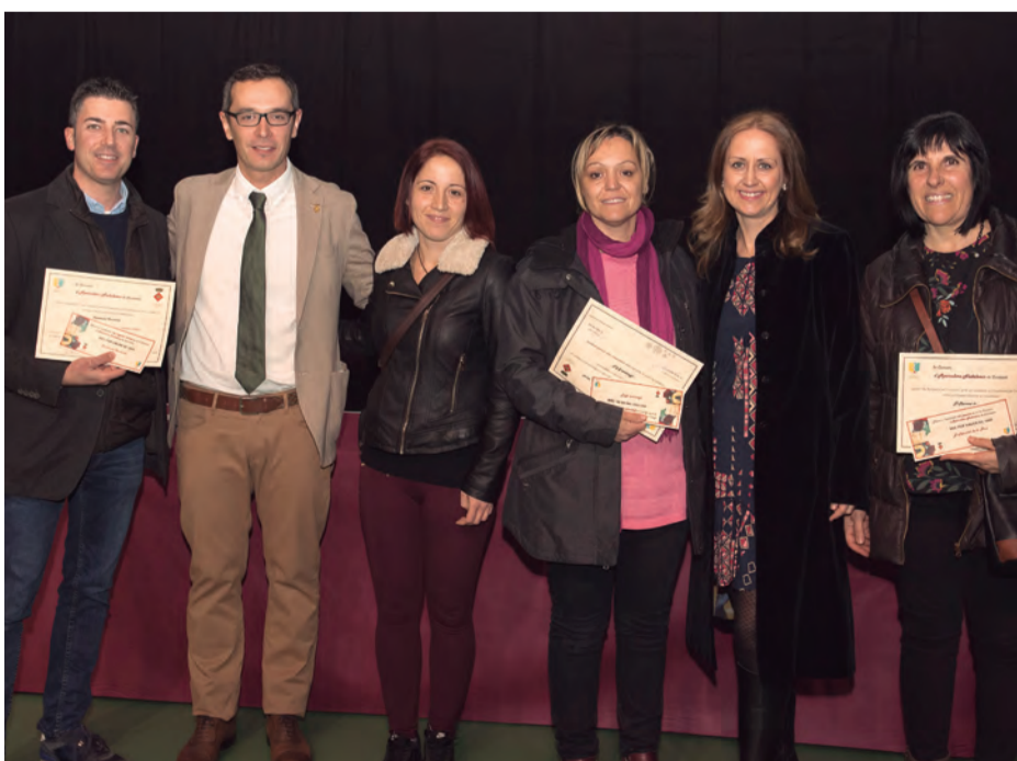
L'alcalde i representants de la Unió de Botiguers, amb els comerços guanyadors

Finalment, també es van entregar els Premis del Concurs Fotogràfic Instagram de Nadal organitzat per l'àrea social del Centre d'Esports Constantí, amb la col·laboració de l'Ajuntament. ■