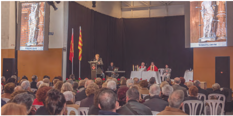
Solemne ofici en honor a Sant Sebastià