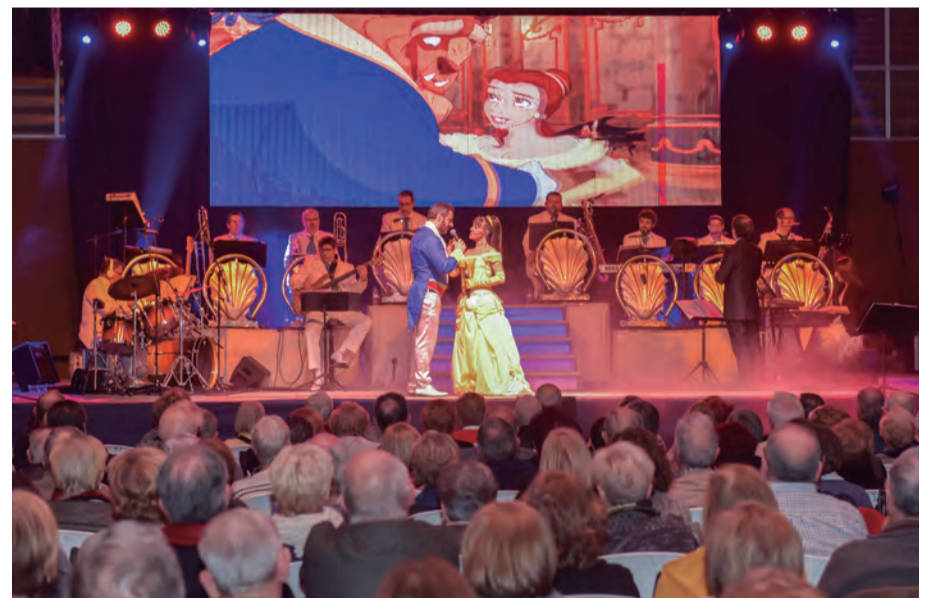
Concert de Tarda amb l'Orquestra Costa Brava