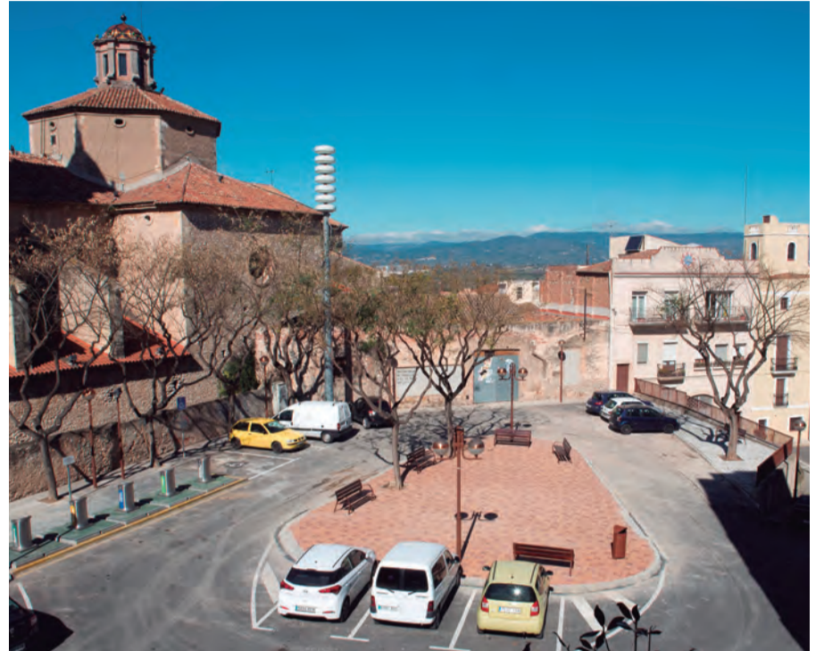
La Plaça del Castell, vista des de dalt, després de les obres

cial per a l'estabilitat de l'espai. Aquests treballs han tingut un termini d'execució aproximadament un mes i han comptat amb un pressupost de 27.961,37 euros (IVA no inclòs). Les obres són un primer pas per a rehabilitar, en un futur, l'antic refugi de la Guerra Civil que es troba sota aquesta plaça.