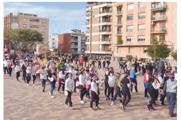
Rua de Carnaval amb la participació de les escoles