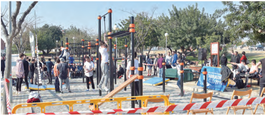
Inauguració del Cal·listènia Street workout