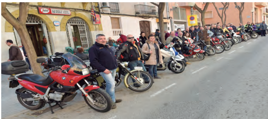
Els participants a la X Sortida de Motos clàssiques a la seva arribada al carrer Major

Prop d'una trentena de participants va prendre part de la X Sortida de Motos Clàssiques que va organitzar Moto Clàssic Constantí el 21 de gener. El recorregut s'iniciava davant de l'Ajuntament, passant per la Selva del Camp, Vilaplana, Alforja i arribant a Porrera on es va fer l'aturada per esmorzar. Un cop retornats a Constantí, es va fer l'exposició de les motos al carrer Major, i es van entregar premis a les 3 motos més antigues. La jornada va finalitzar amb el tradicional vermut. ■