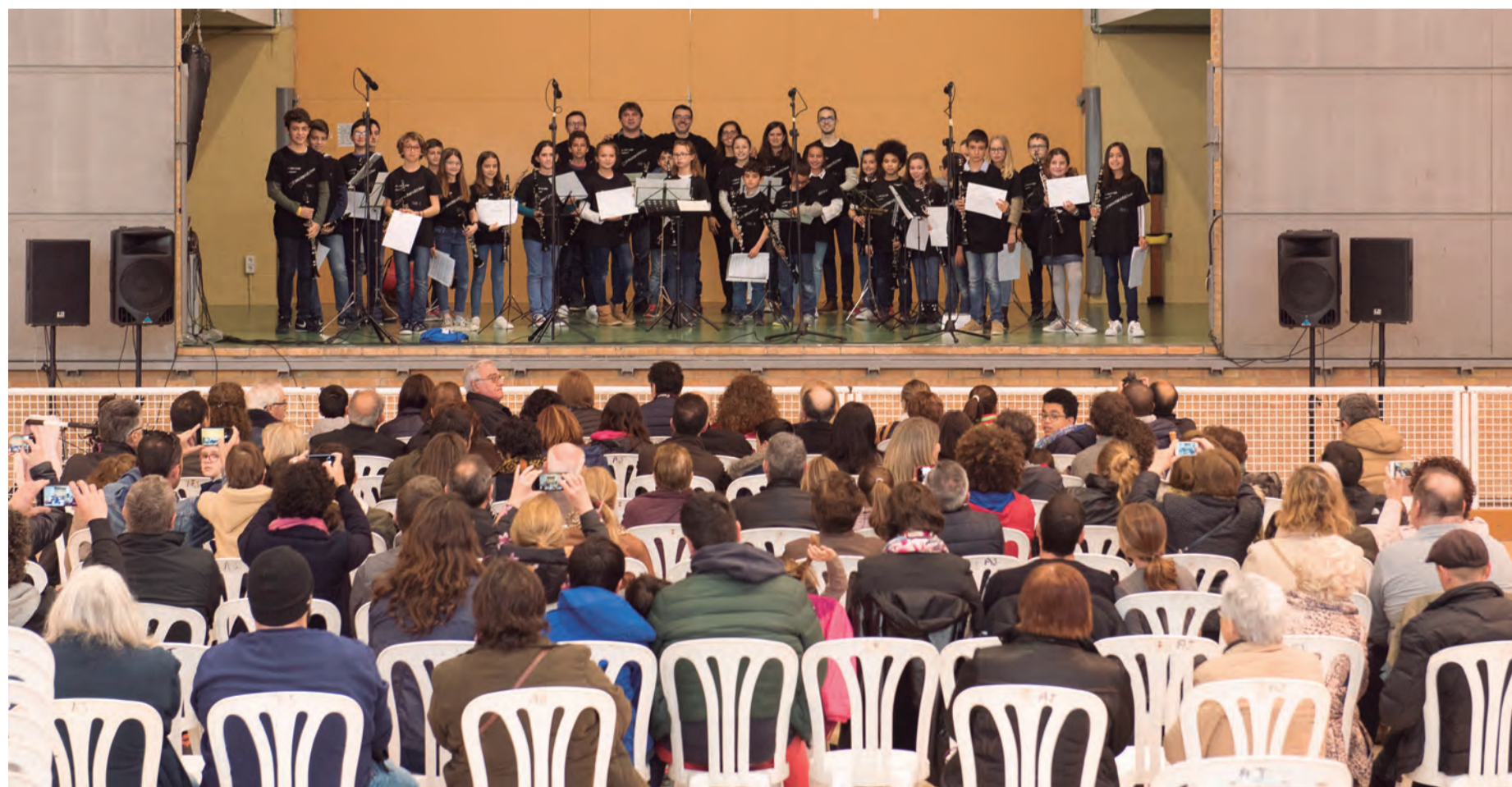
La Trobada va finalitzar amb una actuació conjunta de tots els alumnes i professors participants

gona i la Nova Escola de la Banda Unió Musical, a més del Conservatori Municipal de Música de Vila-seca i l'Escola Municipal de Música de Constantí. ■