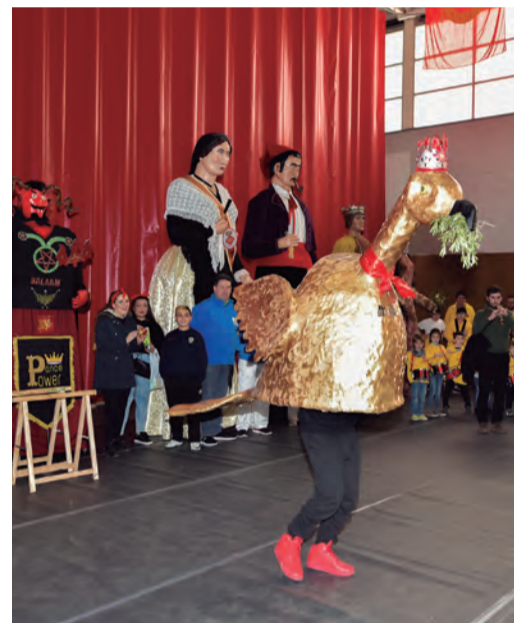
L'Àliga de Constantí durant la seva presentació a la Festa Major d'Hivern

L'Associació Dance Power Constantí va presentar, coincidint amb la Festa Major d'Hivern, un nou element de la cultura popular constantinenca, l'Àliga de Constantí. Aquesta presentació es va fer en el marc de la segona Trobada Gegantera organitzada per aquesta entitat que des de la seva creació a l'estiu del 2015 ha participat activament en el calendari festiu del municipi, tant en les Festes Majors, com també en el Carnaval. El proper mes de maig, a més, presentaran també l'Àliga petita de Constantí, amb una cercavila pels carrers del poble. ■