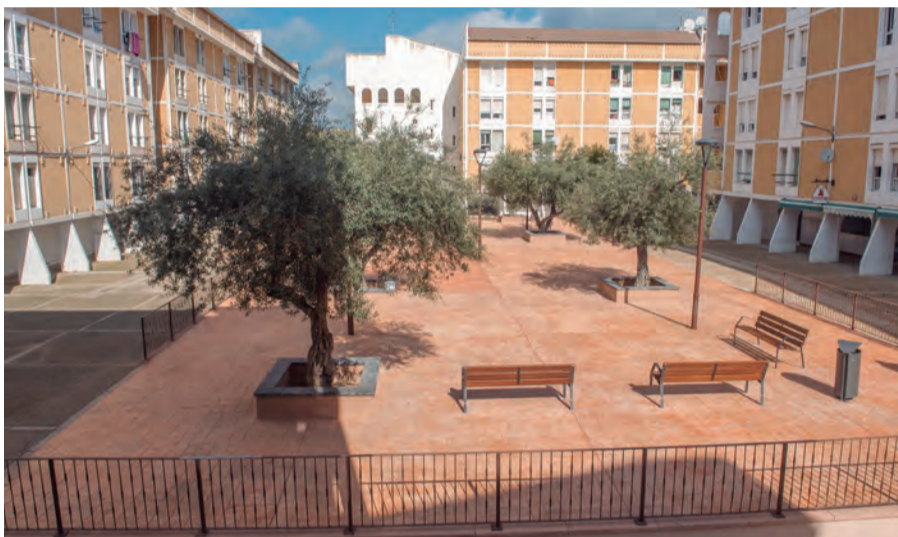
Imatge de la renovada Plaça Juan Ramón Jiménez

Els treballs s'han centrat en la renovació de la pavimentació, l'enllumenat públic, el mobiliari urbà i la jardineria. A més, s'ha volgut millorar també l'accessibilitat de la plaça, suprimint les barreres arquitectòniques. En aquest sentit, les tasques han consistit en la demolició de paviment, nova pavimentació amb formigó estampat, substitució de lluminàries existents, retirada de la palmera existent i plantació d'olivera i instal·lació de mobiliari urbà. El termini d'execució de les obres ha estat de dos mesos i mig, amb un cost de 46.480,80 euros (IVA no inclòs)