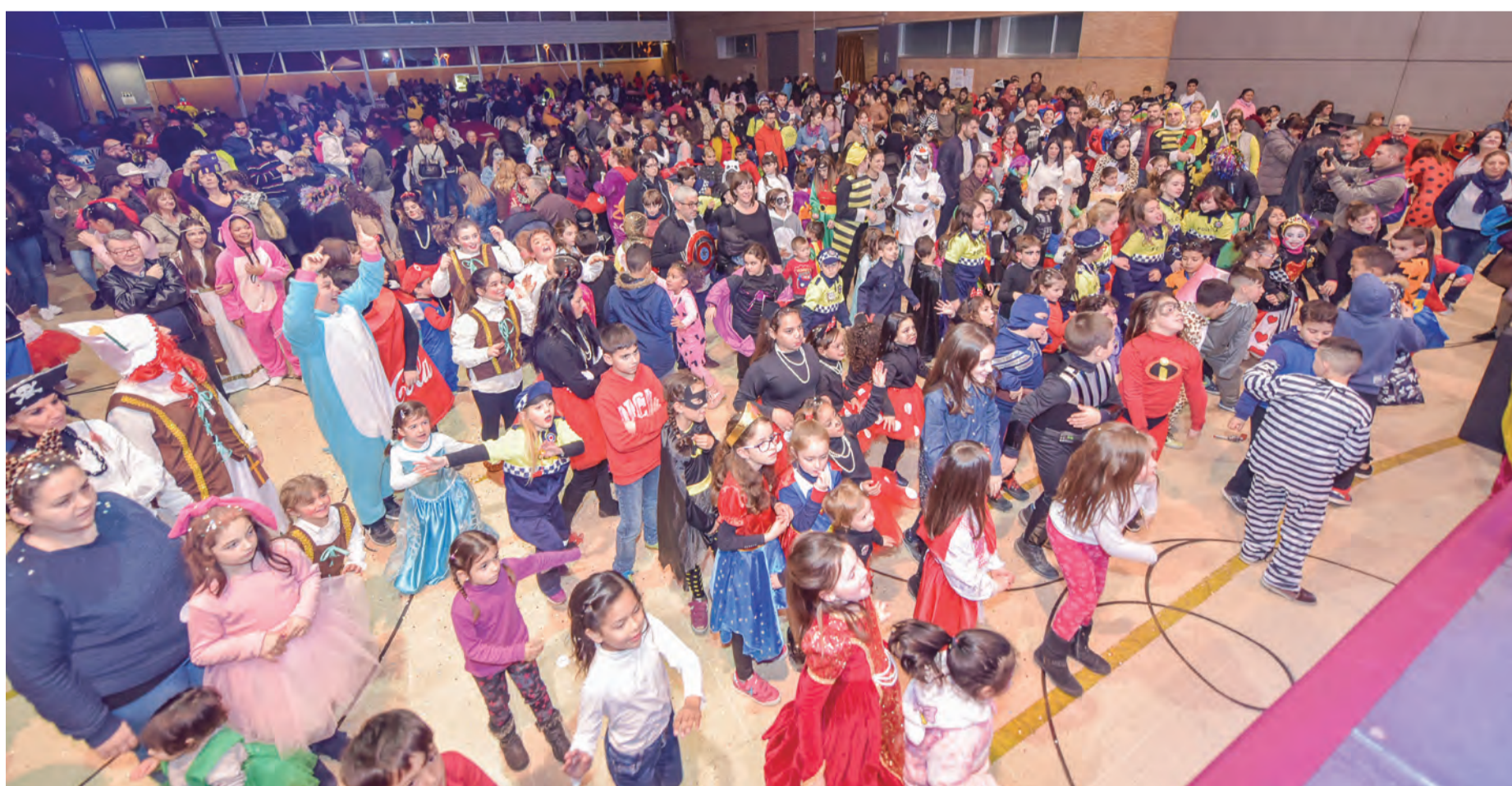
Gran participació al Ball de disfresses al Pavelló Poliesportiu

Durant el ball de disfresses, es va fer entrega dels premis a les tres millors comparses. La Revetlla de Carnaval es va allargar fins ben entrada la matinada amb l'actuació musical d'un DJ. El diumenge 18 de febrer, els actes del Carnaval finalitzaven amb la processó de l'enterrament del Rei Carnestoltes i la tradicional cremada del Ninot. Dintre de la programació del carnestoltes d'aquest any també es va fer la tradicional Guerra de confetti i una Botifarrada Popular, a més de l'acte d'entrega de xumets a la Dragonina, organitzats per l'Associació d'Amics de la Colla C.O.C.A. ■