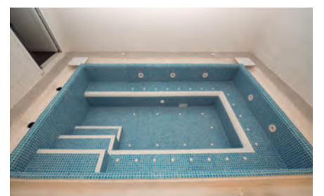
Nova zona d'aigües al Poliesportiu

A finals del mes de gener s'iniciaven les obres de renovació del Pavelló Poliesportiu, un projecte que permetrà l'adequació de l'equipament esportiu de cara a la celebració dels Jocs Mediterranis i suposarà la intervenció més important que s'ha fet des de la seva inauguració l'any 2001. Les obres tenen un import de 176.113,20 euros (sense IVA), amb una aportació de 96.731,27 euros per part de la Diputació. Aquesta reforma contempla l'ampliació dels vestidors, la millora de la ventilació de la pista, el condicionament de la coberta, la climatització de les sales i la instal·lació de plaques solars per escalfar l'aigua, entre d'altres millores. Constantí és una de les 14 seus que acolliran competicions esportives dels Jocs Mediterranis, concretament en la modalitat d'halterofília. ■