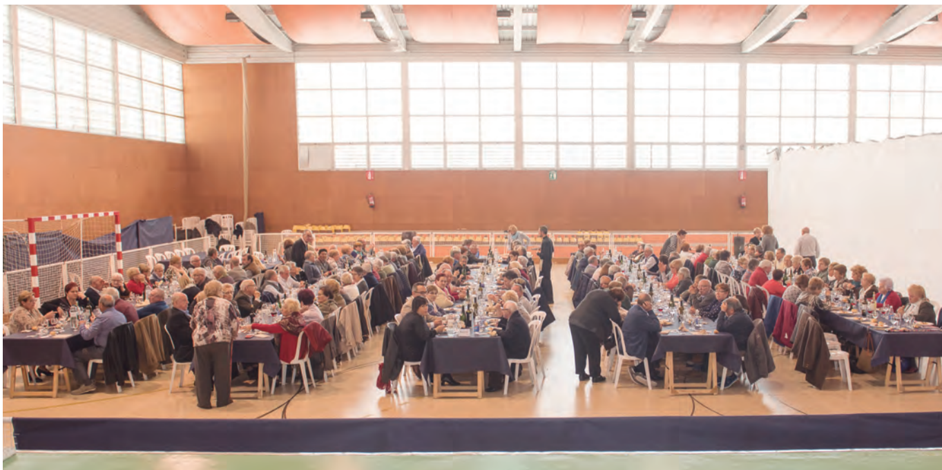
Dinar de Pasqua de l'Associació de Jubilats i Pensionistes