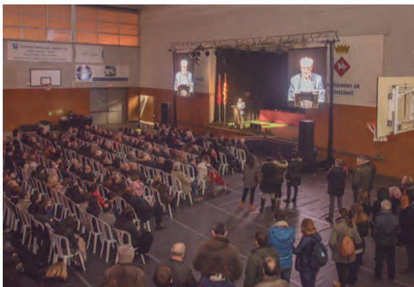
Públic assistent al Pregó de la Festa Major d'Hivern