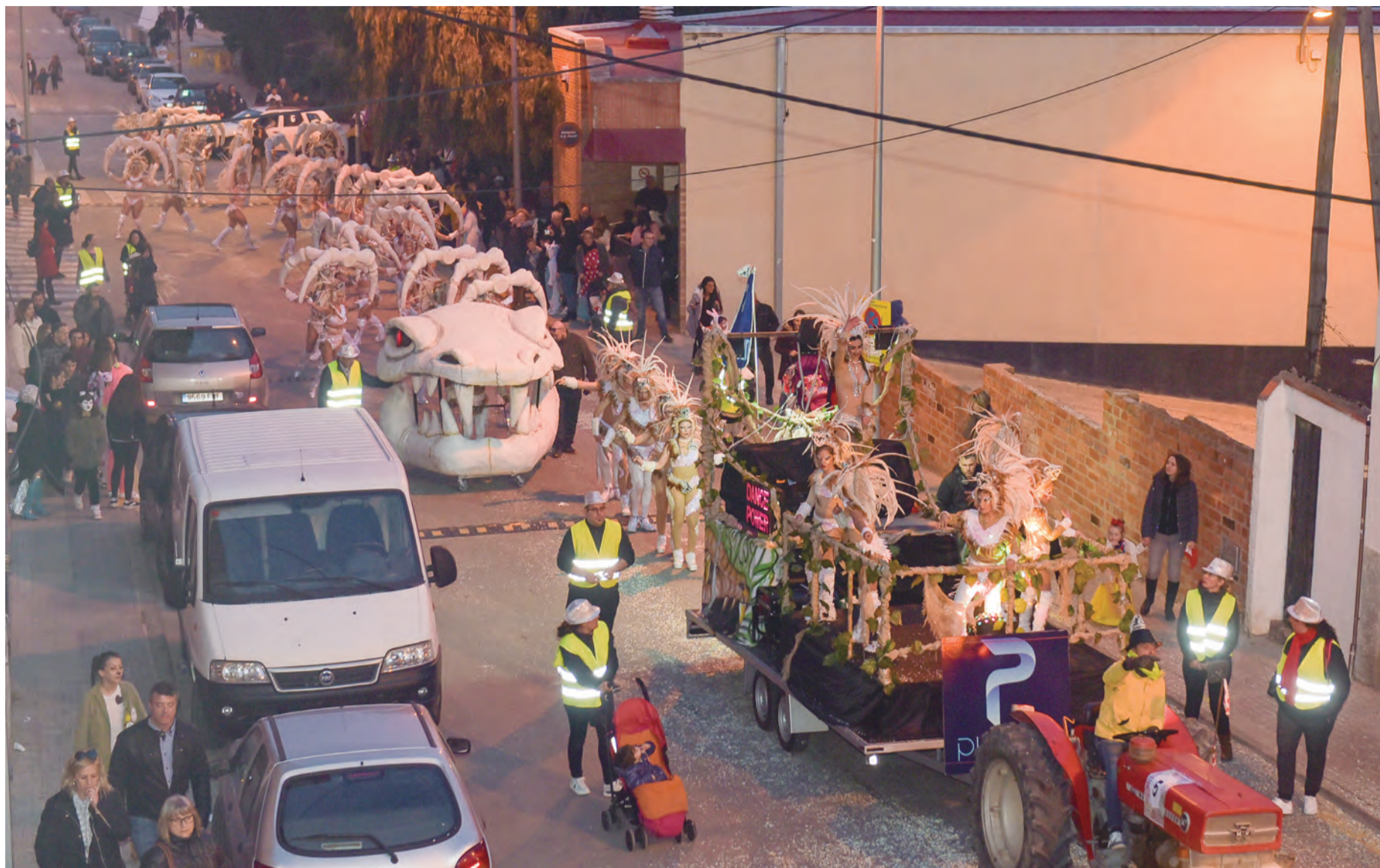
El Despertar de la serpiente (Platinum) va ser la comparsa guanyadora del Carnaval

Constantí va viure el cap de setmana del 17 i 18 de febrer els actes centrals d'un multitudinari Carnaval, que aquest any va comptar amb gairebé 300 participants a la tradicional rua pels carrers del municipi, amb un total de 12 comparses, establint així un rècord de participació. Després del recorregut festiu pels carrers del poble, les comparses van arribar fins al Pavelló Poliesportiu, on ja al vespre va tenir lloc un Ball de disfresses infantil amenitzat per la música en directe de Kids Music. Posteriorment, va tenir lloc un Sopar de motxilla que també va ser tot un èxit de participació, amb més de 500 persones inscrites.