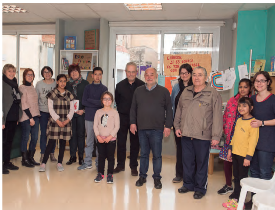
Participants a una nova edició del Bingo de Poesia a la Biblioteca Municipal

El mateix 21 de març es va convidar a tothom qui ho desitgés a omplir la Biblioteca de poesia amb dibuixos, llibres, fotografies, poemes propis o de poetes reconeguts. I, finalment, dissabte 24 de març es va celebrar una nova edició del Bingo de Poesia. Durant l'acte es va fer també la lectura en diverses llengües del poema "La poesia", creat per a l'ocasió pel poeta valencià Marc Granell. ■