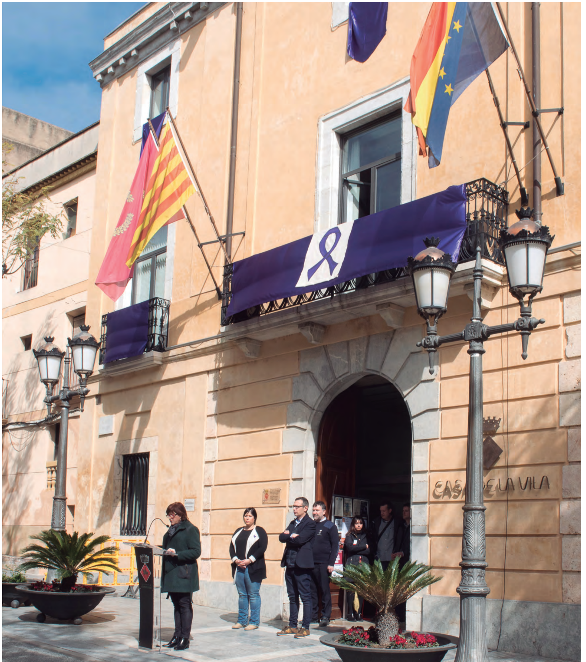
Lectura del Manifest Institucional davant de l'Ajuntament

bàsics de la lectura del manifest, que es va fer com cada any davant de l'Ajuntament davant prop d'un centenar de persones. Després de la lectura del Manifest, es van presentar uns punts de llibre dedicats a les escriptores catalanes Maria Aurèlia Capmany i Montserrat Abelló, coincidint amb la celebració de l'any literari 2018 dedicat a aquestes dues escriptores ■