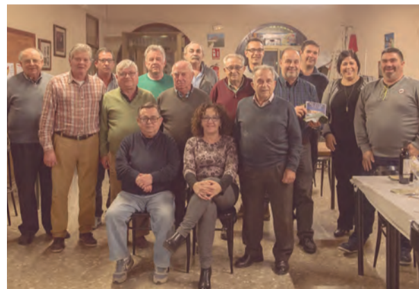
Entrega de Premis del Campionat de Botifarra al Sindicat Agrícola