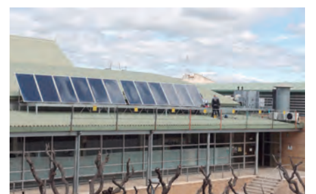
Instal·lació de plaques solars a la coberta del Pavelló