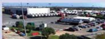
Lavadero de Cisternas