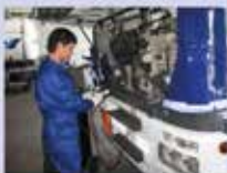
Estación de Servicio